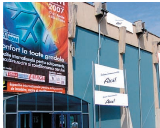
AFISARE BANNERE PE FATADA PAVILIONULUI C1