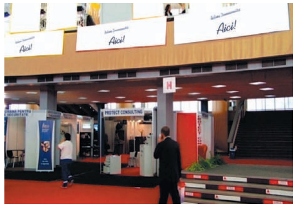
AFISARE BANNERE PAVILION A, FRIZA 4.50