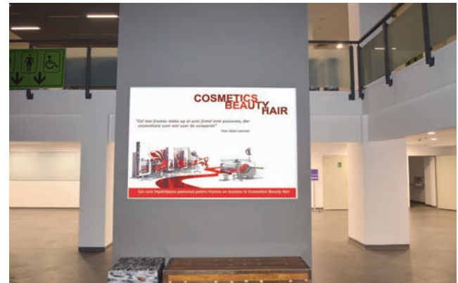
CASETA CU RAMA CLICK, DIMENSIUNE 200X140 CM