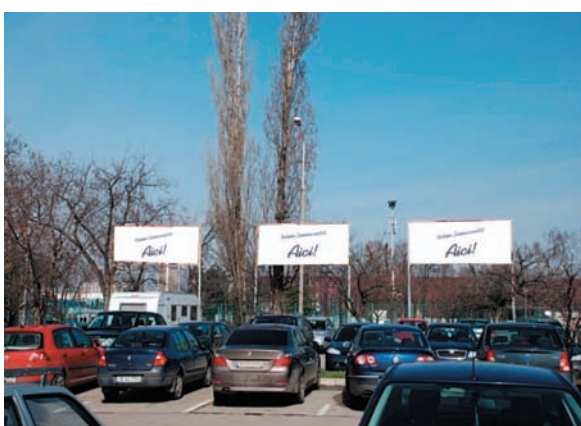
AFISARE BANNERE PARCAJ INTRARE B